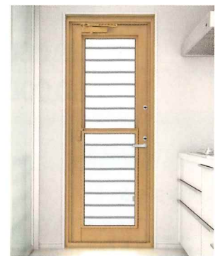
かんたん ドアリモ 勝手口ドア