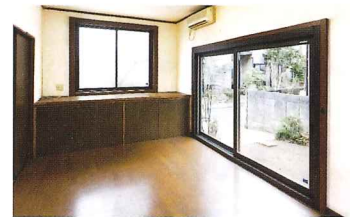
かんたん マドリモ 断熱窓