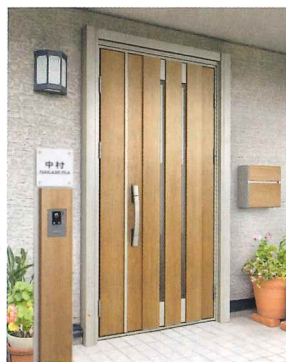
かんたん ドアリモ 玄関ドア