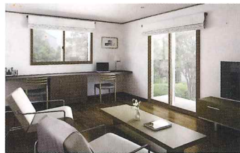
かんたん マドリモ 内窓 プラマードU

プラス「玄関ドア」なら 大 28,000ポイント プラス「勝手口ドア」なら 小 24,000ポイント 合計 91,000 ポイント 合計 87,000 ポイント